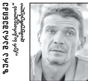
ქოცები საკუთარ თავს ებრძვიან. რაც დრო გადის, „ოცნებას“ ამომჩრჩეველი აკლდება!